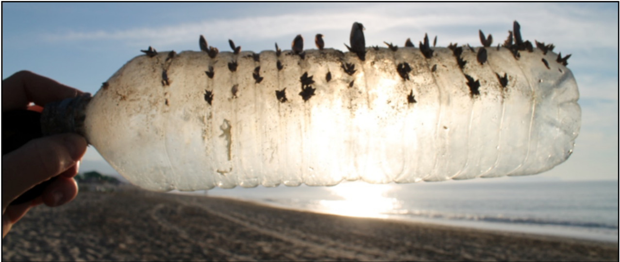
I år der det registrert en økning i antall drikkeflasker og korker funnet på Strandryddedagen. (Foto: Hold Norge rent).

Det er en svak nedgang i funn av plastposer og tau over 50 cm sammenlignet med tidligere år.