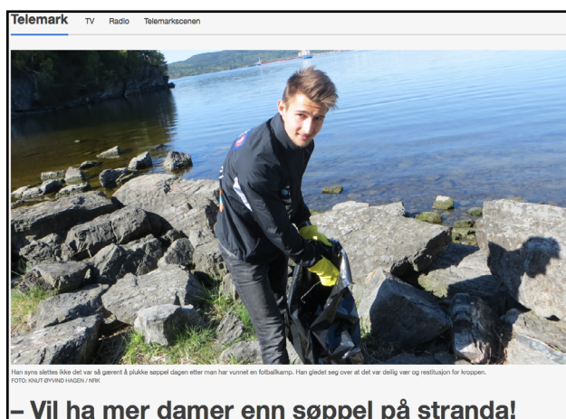
– Vil ha mer damer enn søppel på stranda!