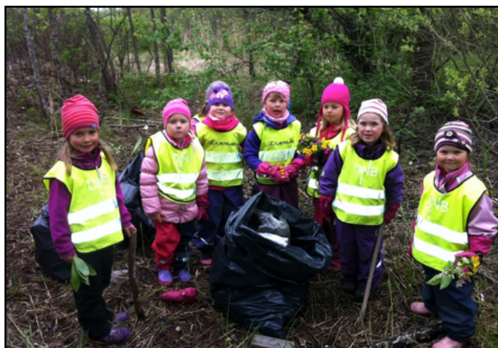
Linnestranda barnehage deltok på Strandryddedagen 2014. (Foto: Linnestranda barnehage).

Strandryddedagen er et viktig ledd i å gjøre befolkning og fagfolk bevisste på miljøtrusselen marin forurensning. Aktiv deltakelse bidrar til å fjerne miljøfarlig avfall fra strendene. Det bidrar også til økt gjenvinning, ved at avfall samles inn gjennom etablerte retur- og innsamlingsordninger. Aktiv deltakelse bidrar ikke minst også til å dokumentere avfallet. Denne dokumentasjonen bidrar til økt kunnskap om sammensetningen og spredningen av avfall i og ved havet, slik at det blir mulig å jobbe mer effektivt mot forurensningskildene. Tallene er viktige i forskningsøyemed, og kan i tillegg benyttes i holdningsskapende arbeid.