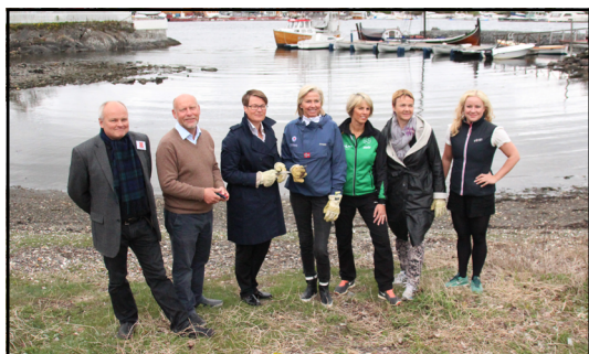
Lanseringen av Strandryddedagen 2014. (Foto: Retursamarbeidet LOOP).

For å skape oppmerksomhet om Strandryddedagen ble det også arrangert en lansering/offisiell åpning. Arrangementet gikk av stabelen fredag 9. mai, dagen før Strandryddedagen. Lanseringen ble holdt på Oslofjordmuseet i Asker.