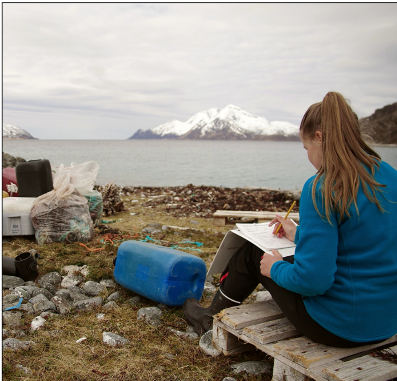
Funn fra strandrydding rapporteres til Hold Norge rent. (Foto: Bo Eide).

Avfall Norge har det juridiske ansvaret for Hold Norge rent, mens LOOP Stiftelsen for kildesortering og gjenvinning har sekretariatsansvaret og kampanjeledelsen. Styringsgruppen til Hold Norge rent består av representanter fra Avfall Norge, Friluftsrådernes Landsforbund, Grønt Punkt Norge, LOOP samt en representant fra kommune/renovasjonsselskap, pt. Lofoten Avfallsselskap. Hold Norge rent er finansiert med støtte fra Avfall Norge, Klima- og miljødepartementet, returselskaper og private sponsorer. Hold Norge rent er under omorganisering for å styrke det frivillige engasjementet mot marin forurensning.