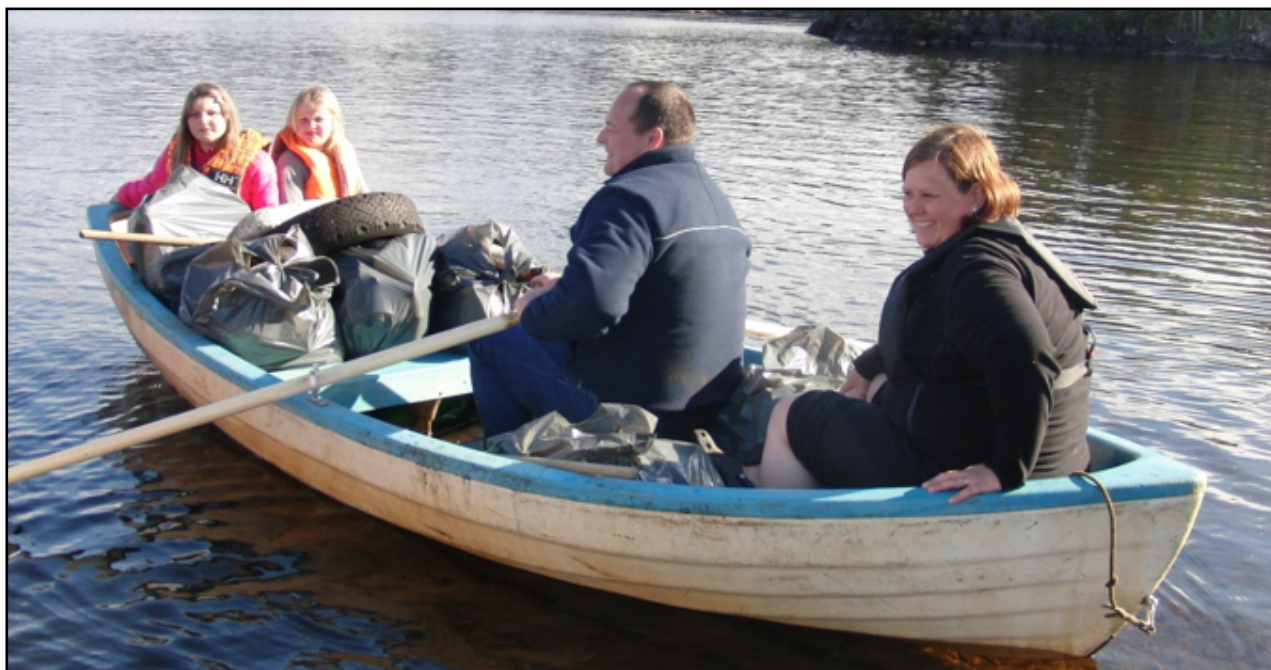
Deltakere på Strandryddedagen 2014.

Denne rapporten gir en oversikt over kampanjen Strandryddedagen 2014 og dens resultater.