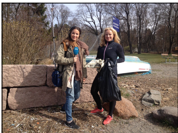
Kampanjeleder er ute med NTB og lager reportasje på Hvaler..

Ut ifra beregninger fra medieovervåkingstjenester antar vi at vi har hatt et sted mellom 500 og 550 oppslag i nasjonale og lokale medier. Her er et utvalg oppslag: