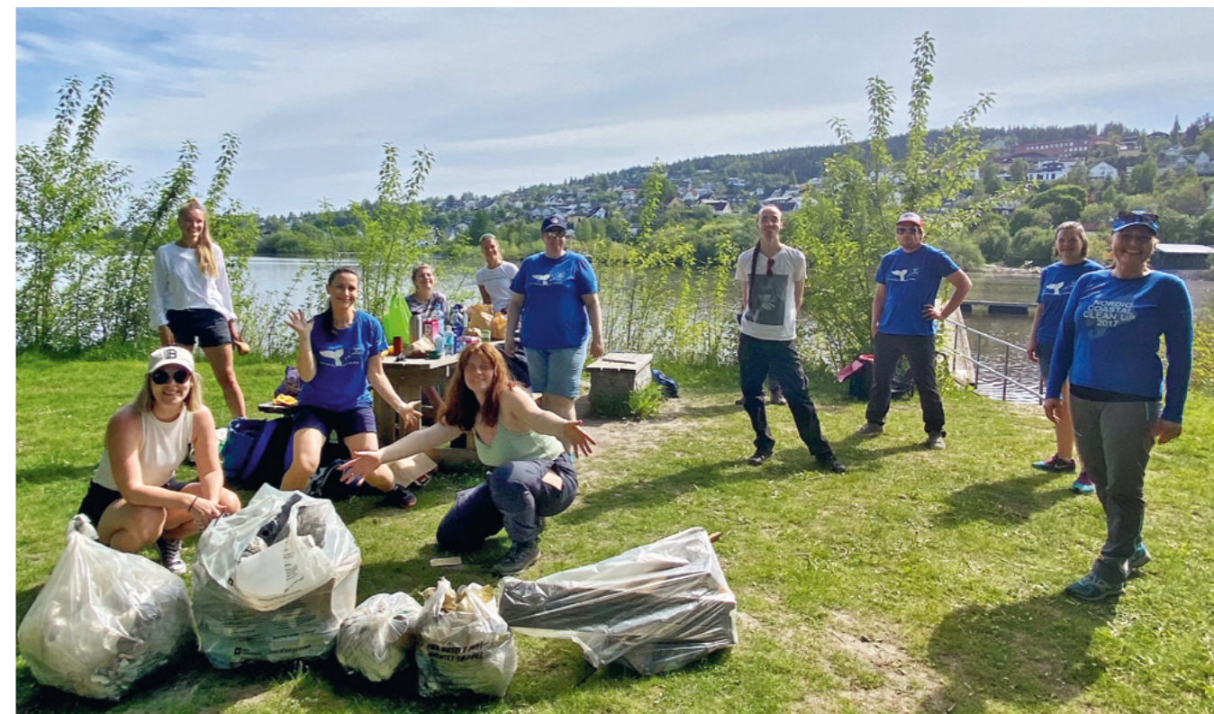
HNRs administrasjon rydder eget adopsjonsområde langs Nitelva i Lillestrøm.

HNRs ryddeaksjoner i egen regi ble finansiert med tilskudd fra Miljødirektoratet.