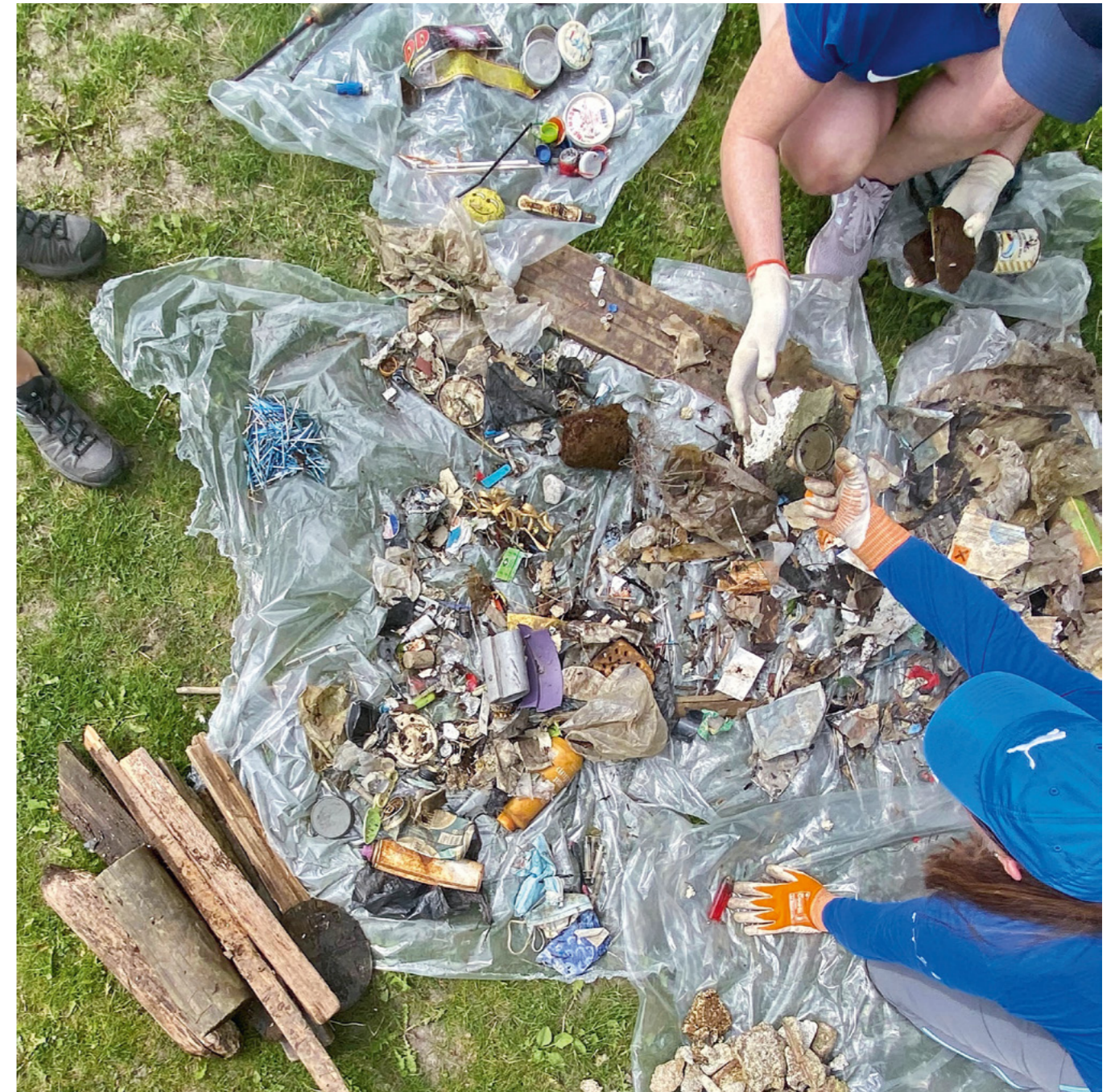
Kartlegging av forsøpling.

Nettverk for frivillig opprydding er en møteplass for aktører som mobiliserer til, tilrettelegger for og/eller koordinerer frivillige opprydding lokalt, regionalt eller nasjonalt. Målet med nettverket er informasjons- og erfaringsutveksling og bedre koordinering og samordning mellom aktørene.