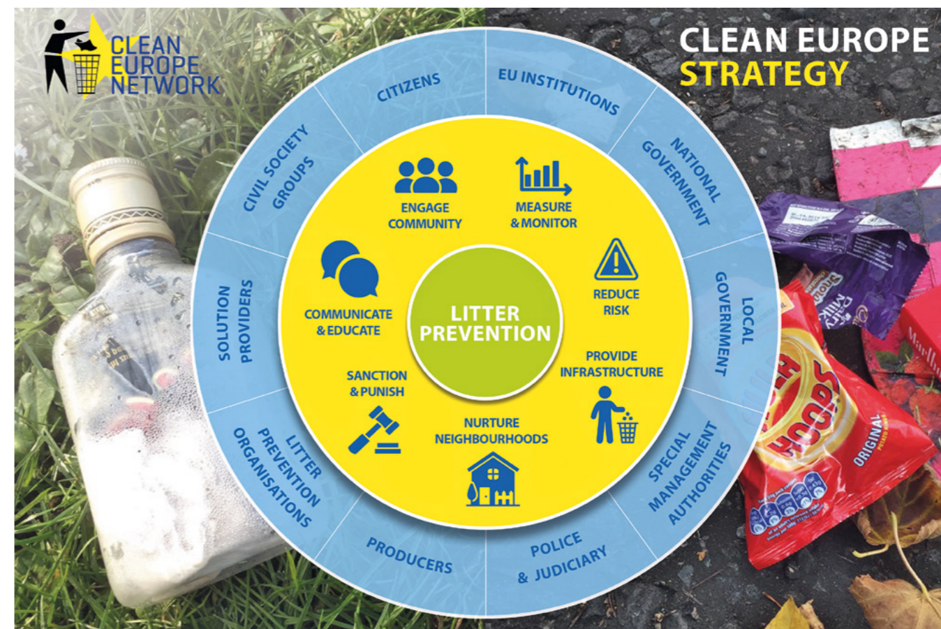
Illustrasjon av Clean Europe Strategy.

Nordisk ryddenettverk skal sørge for videreføring og utbygging av aktiviteter under NCC. Prosjektet