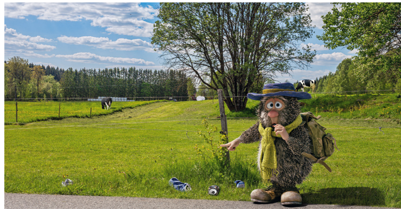
Ludvig bidrar til å spre #likefinsomfør-budskapet etter avtale med Aukruststiftelsen. Illustrasjon: Qvisten Animation.

Hovedtema: Husk å etterlate høsten #likefinsomfør Artikkel: https://holdnorerent.no/aktuelt/husk-a-etterlate-hosten-likefinsomfor Betalt annonsering: ett innlegg på Facebook og Instagram