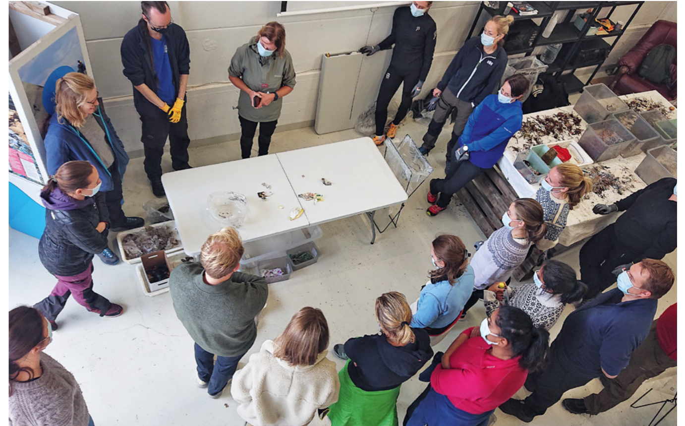
Søppelanalyse etter ryddeaksjon i Bølgen-prosjektet.

HBH finansieres med tilskudd fra Miljødirektoratet og egne midler fra LOOP og HNR.