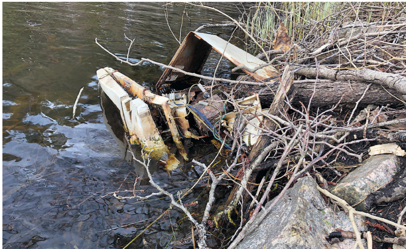
Elektronikk dumpet i elv.