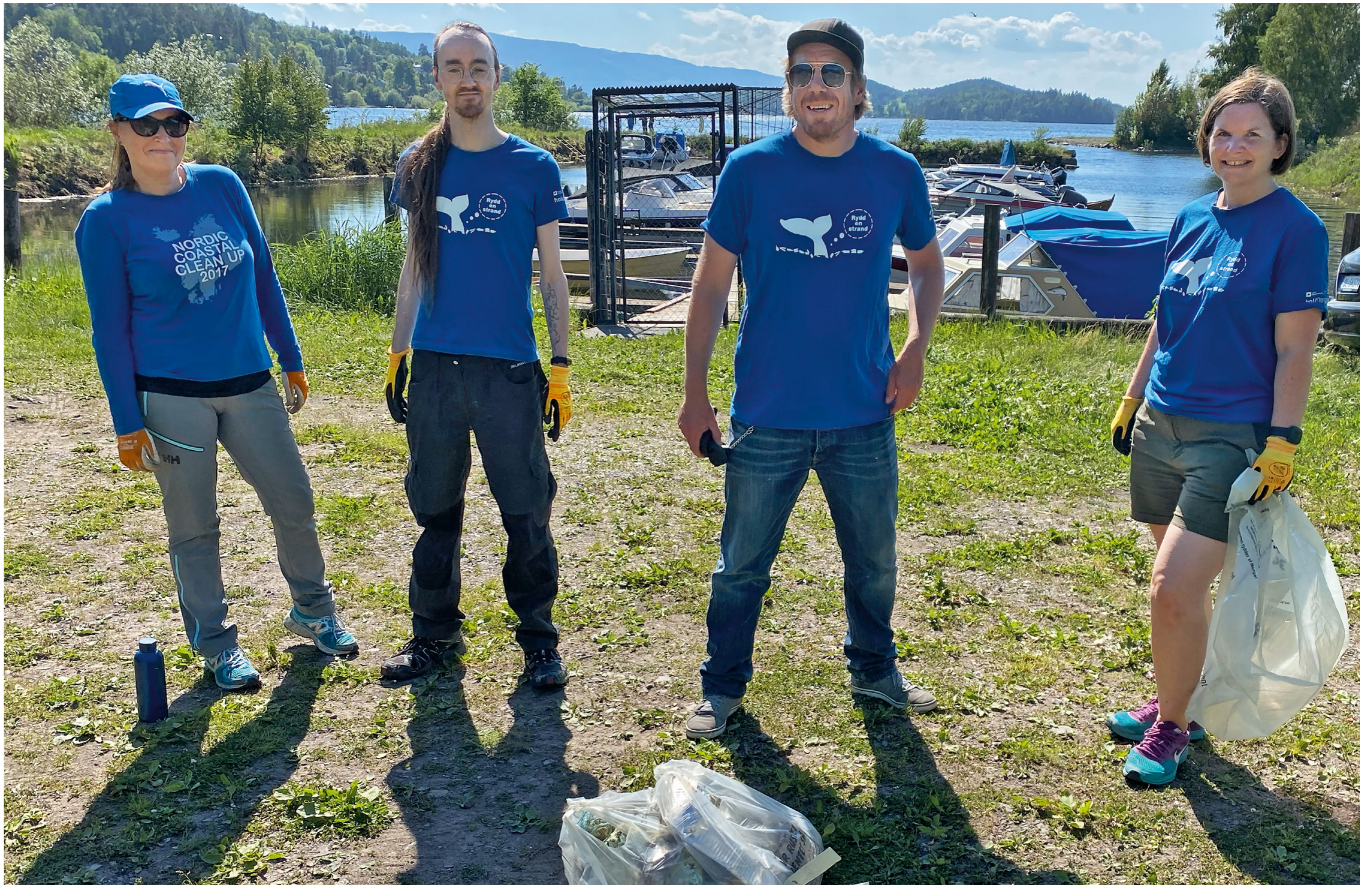
Rydding langs Tyrifjorden.