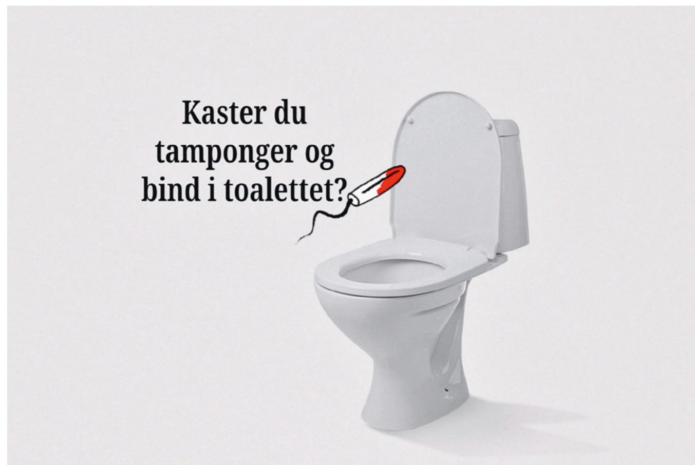
Eksempler fra kampanjen «Det må du nesten bare drite i». Grafisk design og animasjon: Anorak.