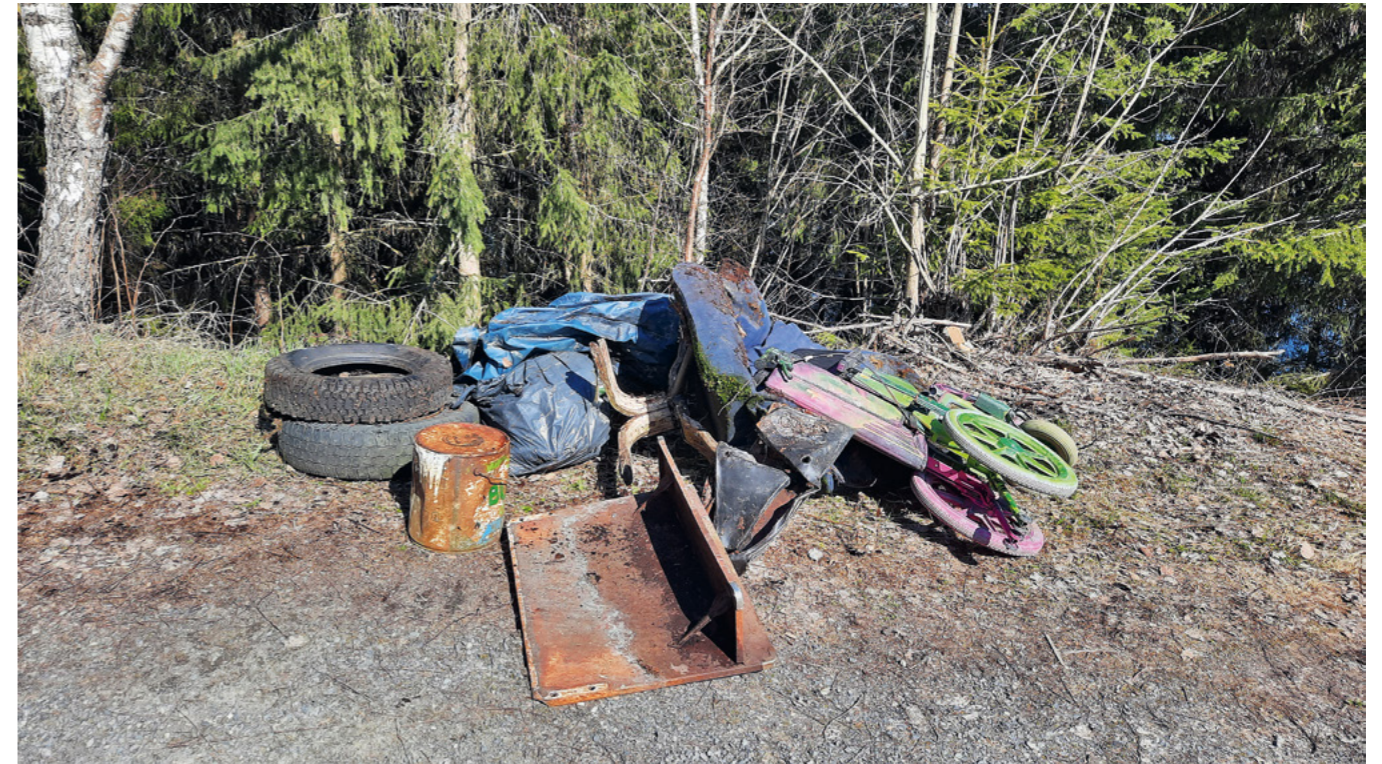
Innsamlet søppel fra «Når snøen har gått» i regi av Hold Innlandet Rent.

Vårryddedagen og Når snøen har gått ble gjennomført med tilskudd fra Miljødirektoratet.